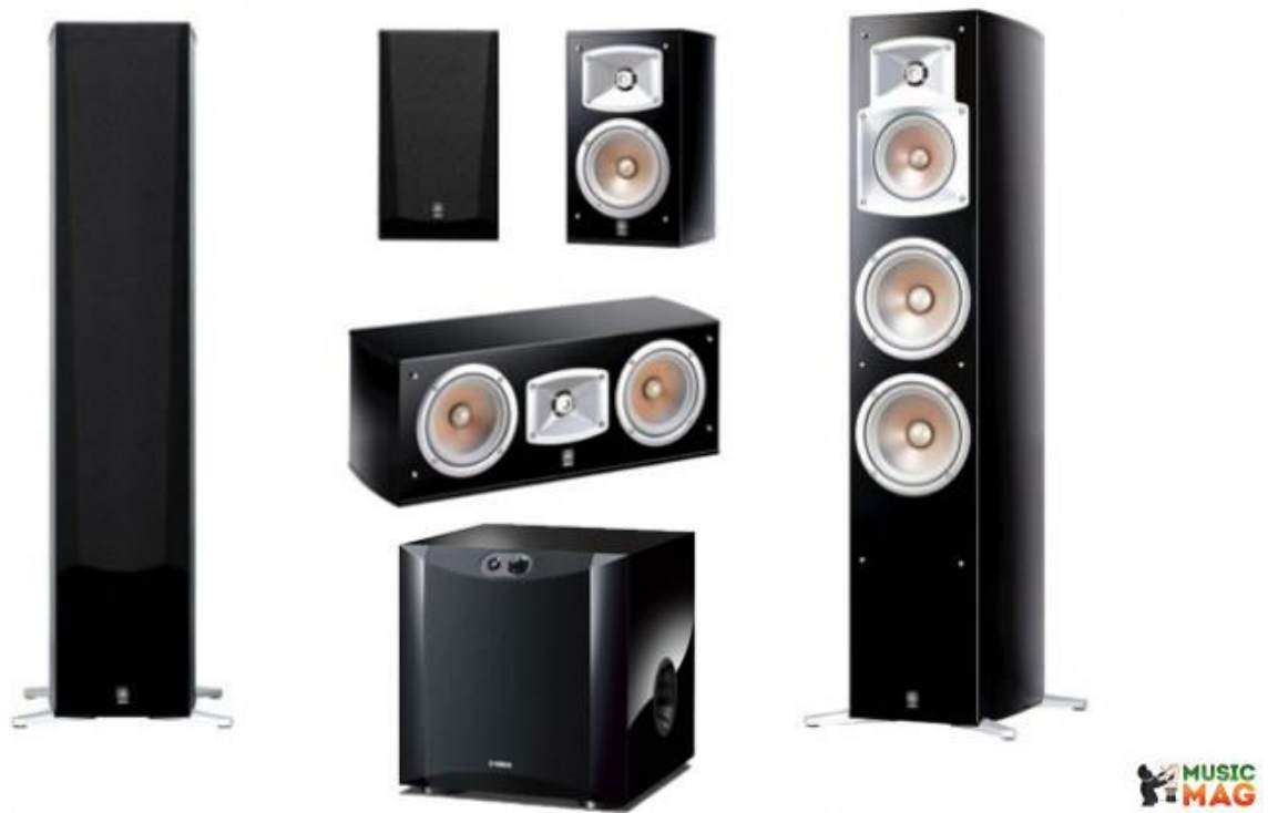
Рисунок 1.2 — Yamaha NS-555 set 5.1

Габаритні розміри клавiатури: 894x254x74 мм, вага 3 кг. Ціна нижча за попередній варіант – 67602 грн [2].