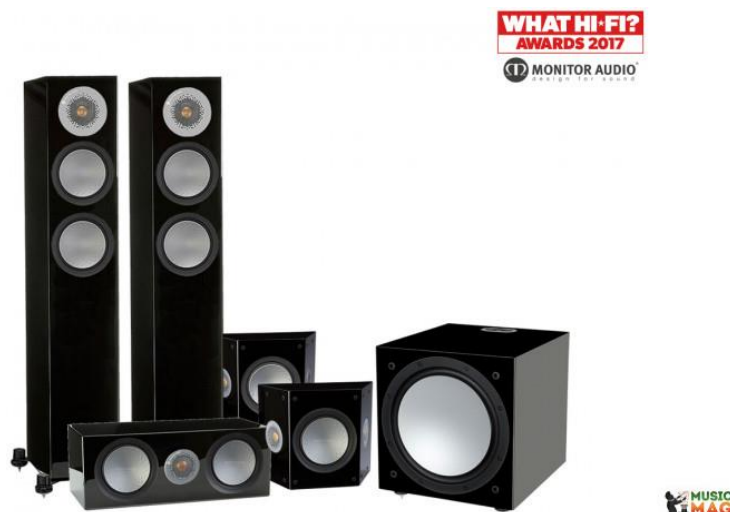
Рисунок 1.1 — Monitor Audio Silver 200/FX/centre150/W12 set 5.1 Black High Gloss

Ця пасивна система встановлюється в приміщенні та розрахована на кімнати для гостей, або на велику вітальню. Має більшу концентрацію на чистоті високих та середніх частот. Для цього для твітерів (динаміки верхніх частот) в якості матеріалу використовується надтонка пластина золота, що забезпечує виключну чистоту звучання верхніх частот. Система потребує зовнішній ресивер-підсилювач для роботи та дорогий з'єднуючий кабель для запобігання втрат в звучанні. Ціна виробу 93 599 грн [1].