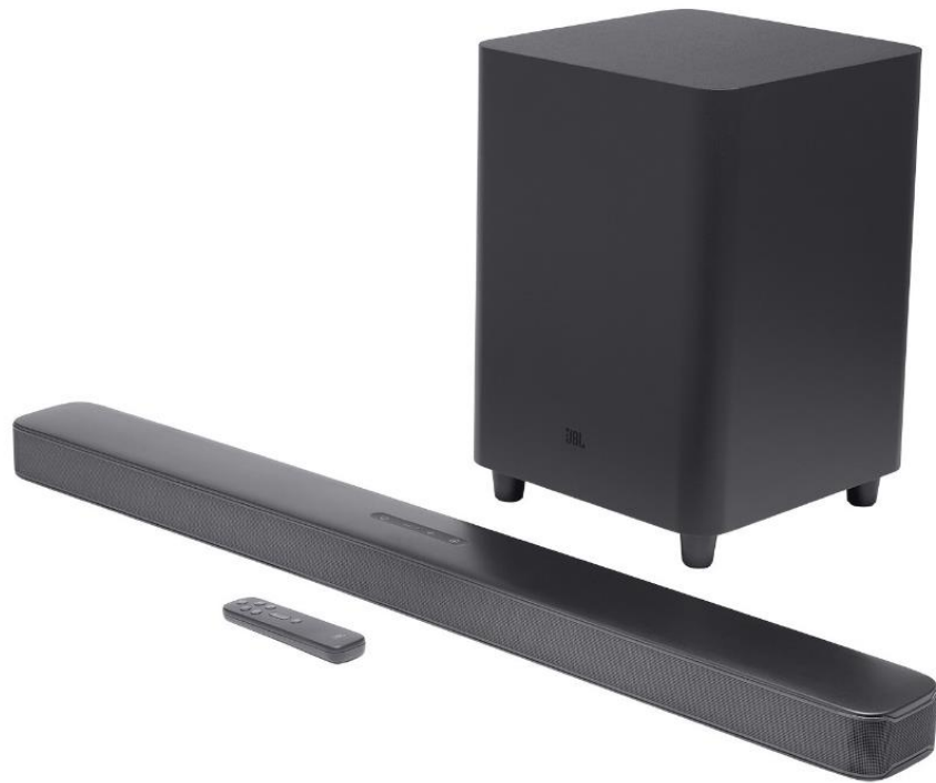
Рисунок 1.3 — Саундбар JBL Bar 5.1 Surround Black