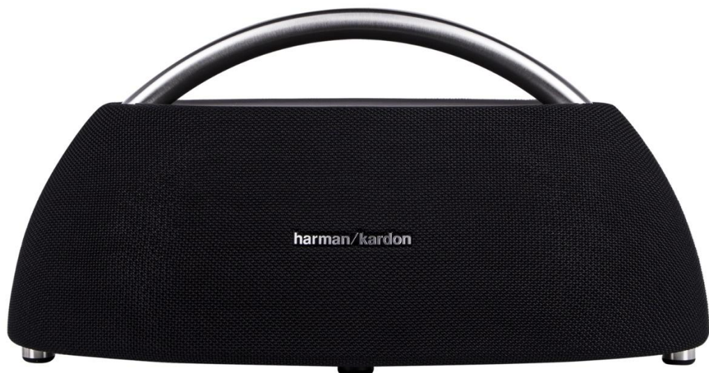
Рисунок 1.4 — Harman/Kardon Go+Play Mini Black

Це представник повністю бездротових колонок, який з самого початку задумувався як портативна колонка для підключення до нього мобільних пристроїв таких як телефони та планшети.