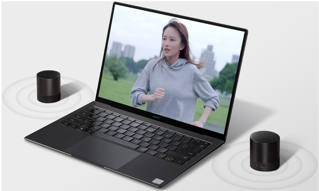
Рисунок 1.5 — Huawei Mini Speaker (CM510) в парі.

Ціна товару: 954 грн за одну одиницю [6].